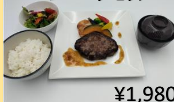
シェフ手作りビーフ100% ハンバーグセット