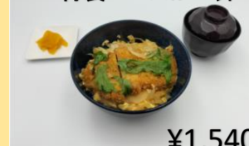
真狩ハーブポークの 特製ロースかつ丼