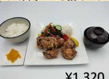
知床鶏のから揚げセット