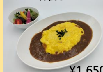
シェフ特製オムカレー