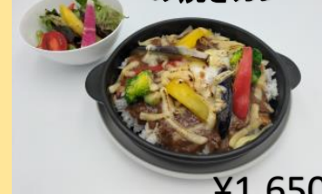
温泉卵と季節野菜 の焼きカレー