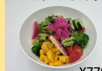
新鮮野菜の コンビネーションサラダ