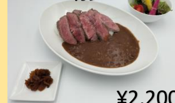
シェフ特製ビーフステーキ カレー