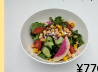
新鮮野菜と温泉卵の シーザーサラダ