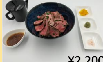
シェフ特製ステーキ丼 ひつまぶしスタイル