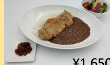
真狩ハーブポークの ロースカツカレー